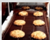
Bodenüberzug jeglicher Warengösse.