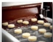
Eingangsgitter und 2 Schokoladenschleier.

Die E220 ist aus Edelstahl und hat ein Design für eine einfache Reinigung. Die Überzugsektion kann zur Reinigung von der Maschine abgekoppelt werden.