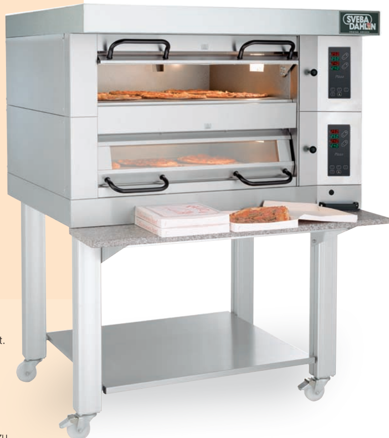
Classic Pizzaofen, Modell-Nr. DC-22P

Die Classic Pizzaöfen sind modular aufgebaut, das heißt, Sie können Ihren Ofen an Ihren Produktionsbedarf anpassen. Die Öfen sind in vier verschiedenen Breiten von 635 mm bis zu 1580 mm erhältlich und können auf bis zu drei Etagen aufgebaut werden.